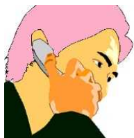
宅配業者を名乗る犯人