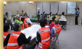
全体の流れを説明

18名のボラ協メンバーにご参加いただき、災害時に駆けつけてくれるボランティアの受付から現場派遣までの流れを確認しました。役を交代しながら実際の動きを体験することで、より現実的な課題も見つかりました。今後も訓練を重ねていきたいと思っております。