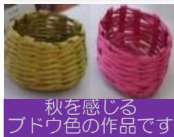
秋を感じる ブドウ色の作品です