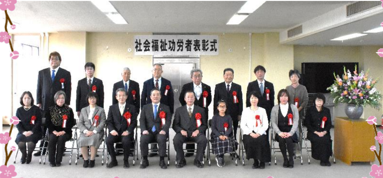
社会福祉功労者表彰式

受賞おめでとうございませ 2月2日に令和4年度栄町社会福祉 功労者表彰式を開催しました