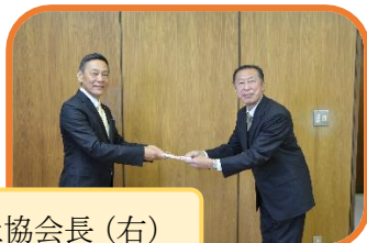
ナリタヤ菊川社長 (左) 社協会長 (右)