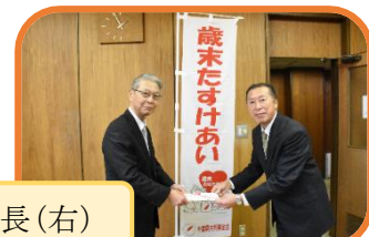
越智上席顧問(左) 社協会長(右)

認定 NPO 法人さわやか青少年センターが、「ふれあいボランティア活動を行った感想文や私の成長」をテーマに全国から感想文の募集を行いました。応募総数120点のなかで栄町では1人が小学生賞を受賞しました。ボランティア体験活動により、人とふれあい、心を通わせ、地域や社会を知り、考え、学ぶことで、豊かな人間関係を育て、よりよい社会づくりにもつながります。