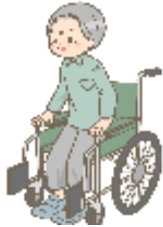
障がい者の いる世帯