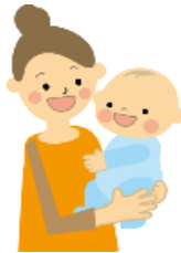
乳幼児又は妊産 婦のいる世帯