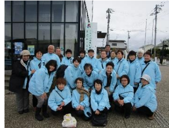
久ノ浜防災センター前にて

14:46分鎮魂復興のサイレンと共に合掌（黙とう）サイレンが終わり帰りかけたらエプロン姿のご婦人が、おひとりおひとりに「ありがとうございました」と頭を下げていました。その人の姿に、そしてボランティア活動を続けて来て良かった、いわき市を忘れてはいけません！！来年もこの水色のベストで慰霊に来たいと思い！！熱くこみ上げるものを防潮堤の上に残して帰路のバスに乗りました。