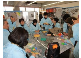
折鶴を折りました